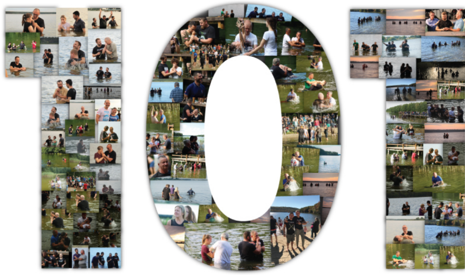
101 baptisms of the born-again, the Megachurch project in Poland 2019

Lob sei Jesus! Wir haben das Jahr 2019 mit 101 Taufen von Neubekehrten abgeschlossen. Es waren fast 300 Taufen in weniger als drei Jahren nach dem Start des Megachurch-Projekts in Polen und auf der ganzen Welt. Über 300 Menschen erhalten weiters regelmäßig biblische Bildung in drei verschiedenen Jahrgängen.